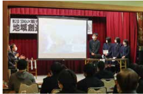
◀パネルディスカッションでは高校生が地域おこしのアイデアを発表した。